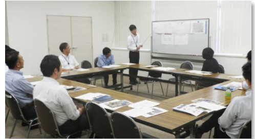
体験成果の発表・意見交換