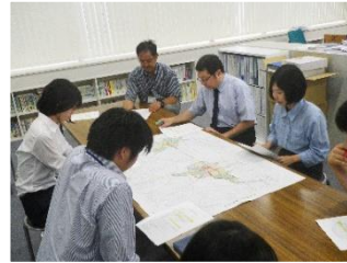
提案・提言のプレゼン

社会インフラを担う技術力を、先輩技術者や若手社員と一緒に体験してみませんか。社員一同、心よりお待ちしております。